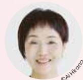
セレノグラフィカ