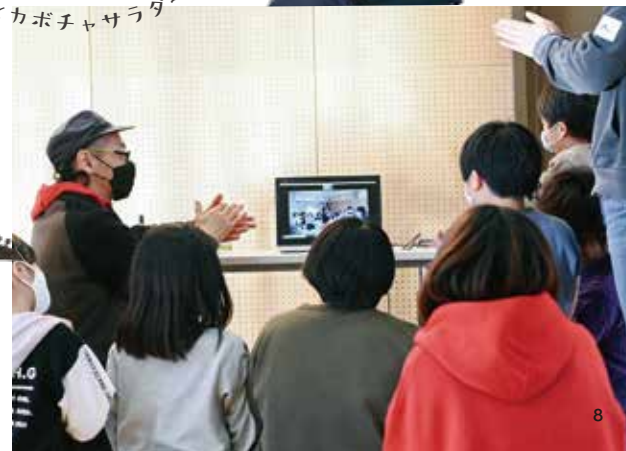
♪てんとう虫とカボチャサラダ〜