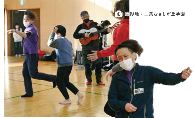
撮影地：二葉むさしが丘学園